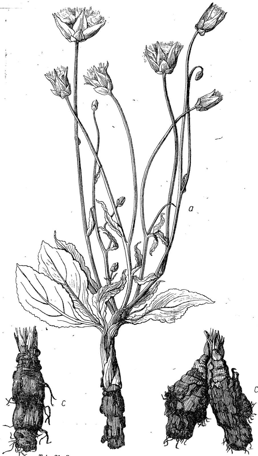
Tab. 21. Scorzonera ovata Trautv. a) habitus ( \frac{2}{3} ); c) tuber ( \frac{2}{3} ).