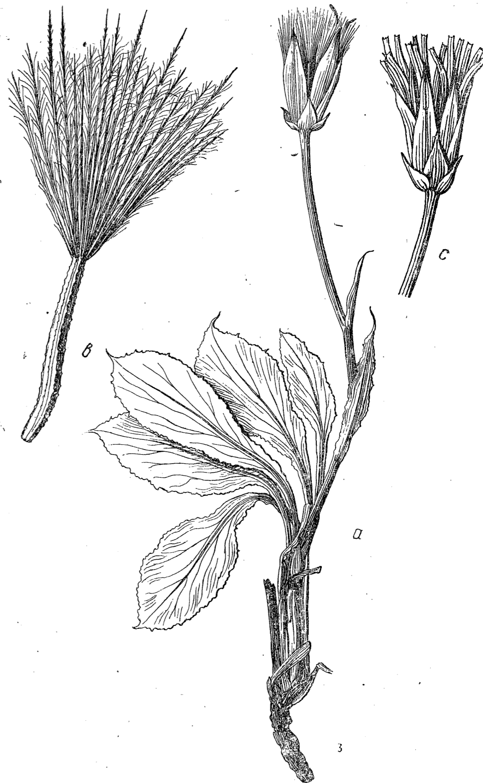
Tab. 20. Scorzonera crispatula Boiss. a) habitus ( \frac{2}{3} ); b) achenium ( \times 3 ); c) capitulum ( \frac{1}{1} ).

Изученные экземпляры: 1) Regnum Granatense, Serro Caronaso, pr. Malaga. A. Solana de la Iuewa m. Sierra de Alsacar, sol. calcar. argillos., 70—1500 m Huter, (Porta Rigo), ex itinere hispanico, 1/V—3/VII 1879, № 1033; 2) In graminosis inter Jesa et fluvium Aragon in Navarra, VI 1850, № 262, Willkomm. (Iter hisp. secund); 3) Castijo Blanco près Ronda dans les endroits pierreux, 21/VI 1849, E. Bourgeau