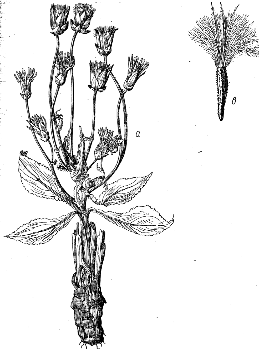
Tab. 21. Scorzonera ovata Trautv. a) habitus (2/3); b) achenium (x4);