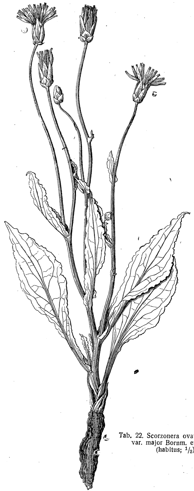
Tab. 22. Scorzonera ovata Trautv. var. major Bornm. et Sint. (habitus; \frac{1}{2} ).