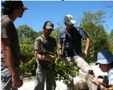
Auf Pflanzenjagd in Zentralkuba