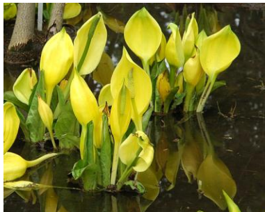
Sümpfe Nordamerikas: Gelbe Scheinkalla ( Lysichiton americanus )