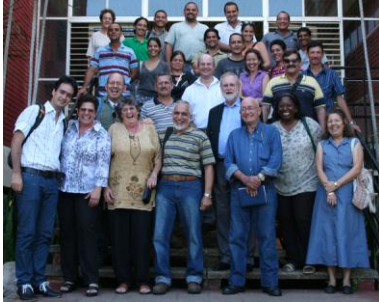
Teilnehmer des Workshops zur Flora von Kuba in Havanna