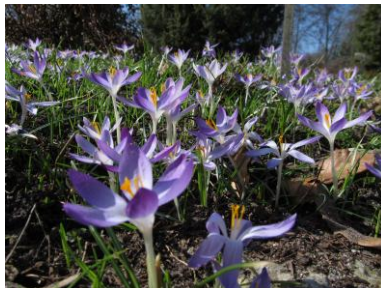
Am Fuße des Balkans