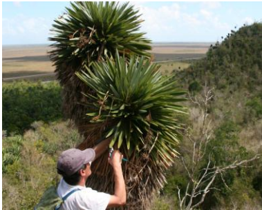
Sammeln von Belegen der seltenen Palme Hemithrinax ekmaniana auf tropischen Karsthügeln in Kuba