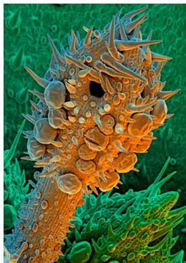
Bild 5: Gestieltes Blütenköpfchen mit runden Öldrüsen beim Marienblatt Tanacetum balsamita