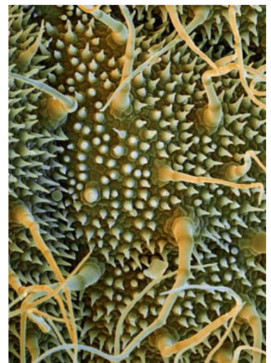
Bild 6: Drüsenhaare auf der Blattoberfläche der Zitronen- melisse Melissa officinalis