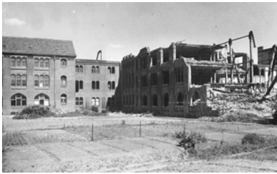
Bild 7: Herbar und Bibliotheksflügel des Botanischen Museums, zerstört beim Bombenangriff im Jahre 1943.