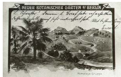
Bild 5: Ansichtspostkarte, zwischen 1905 und 1915 Botanischer Garten und Botanisches Museum Berlin-Dahlem, Archiv