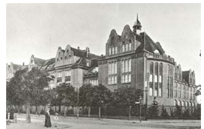
Bild 6: Das Botanische Museum um 1910, Postkarte.