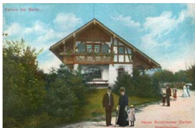
Bild 4: Ansichtspostkarte, zwischen 1905 und 1915 Botanischer Garten und Botanisches Museum Berlin-Dahlem, Archiv