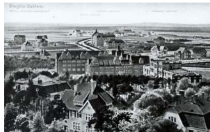
Bild 2: Postkarte um 1910 Botanischer Garten und Botanisches Museum Berlin-Dahlem, Archiv