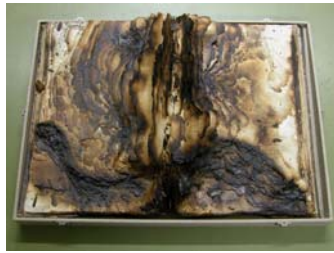
Bild 8: William Curtis, Flora Londinensis, Band 2, London 1781–1798, zerstört beim Bombenangriff im Jahre 1943. Botanischer Garten und Botanisches Museum Berlin-Dahlem, Bibliothek