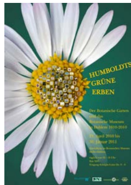
Bild 11: Plakat zur Sonderausstellung Grafik: I. Haas, Botanischer Garten und Botanisches Museum Berlin-Dahlem