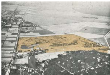
Bild 1: Der neue Botanische Garten aus 490 m Höhe vom Luftballon aus gesehen, 21. 5. 1901