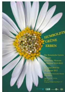
Bild 11: Plakat zur Sonderausstellung Grafik: I. Haas, Botanischer Garten und Botanisches Museum Berlin-Dahlem