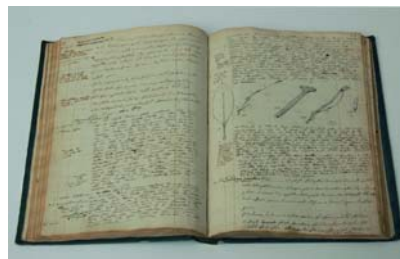
Bild 14: Aimé Bonpland & A.v. Humboldt, Journal de botanique . Leihgabe: Muséum National d'Histoire Naturelle, Paris I. Haas, Botanischer Garten und Botanisches Museum Berlin-Dahlem