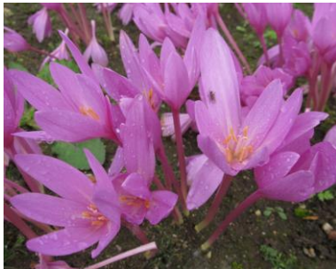
Herbstliche Blüten, herbstliche Früchte, herbstliches Laub