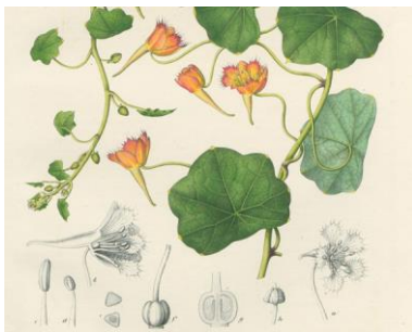
Seltene deutschsprachige botanische Zeitschriften von 1753 bis 1914 online