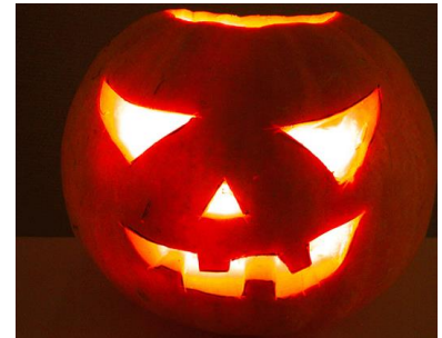
Viel Spaß beim Halloweenfest für die ganze Familie mit Kürbisschnitzen, Kindertheater, Gruselkabinett und vielem mehr am 27. Oktober 2013