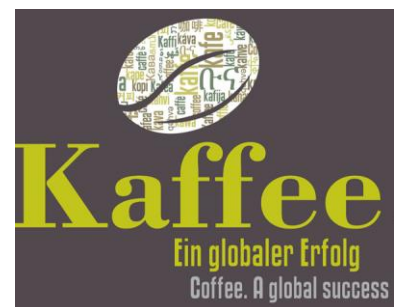
Vorschau November: Ganz viel Kaffeeangebote für Große und Kleine