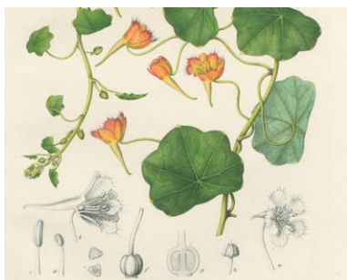
Erste Abbildung der Kapuzinerkressenart Tropaeolum moritzianum