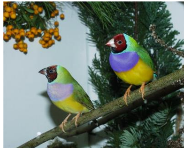
Vogelschau im Botanischen Garten: von Ara bis Zebrafinken, 11.-13. Oktober 2013