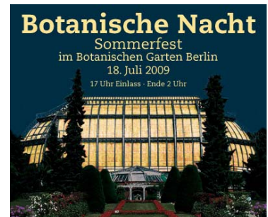
Vorschau Juli – Botanische Nacht am 18. Juli