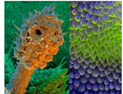
Drei neue Ausstellungen im Botanischen Museum: Von Darwin zu Pflanzenoberflächen