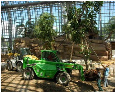
Die Tropen kehren zurück: Die Bepflanzung des Großen Tropenhauses hat begonnen