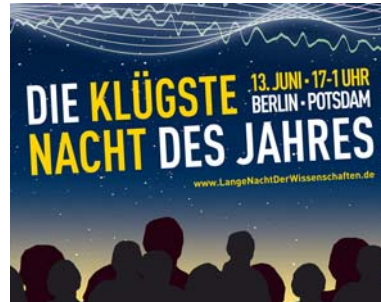
Lange Nacht der Wissenschaften am 13. Juni 2009: Einblick hinter die Kulissen