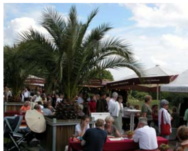
Sommerkonzerte, Weinfest, Kunstmarkt, Führungen und Vorträge im Juni